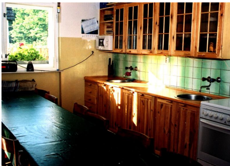
Tu varíme a túto kuchyňu sme si vyrobili sami v dielni