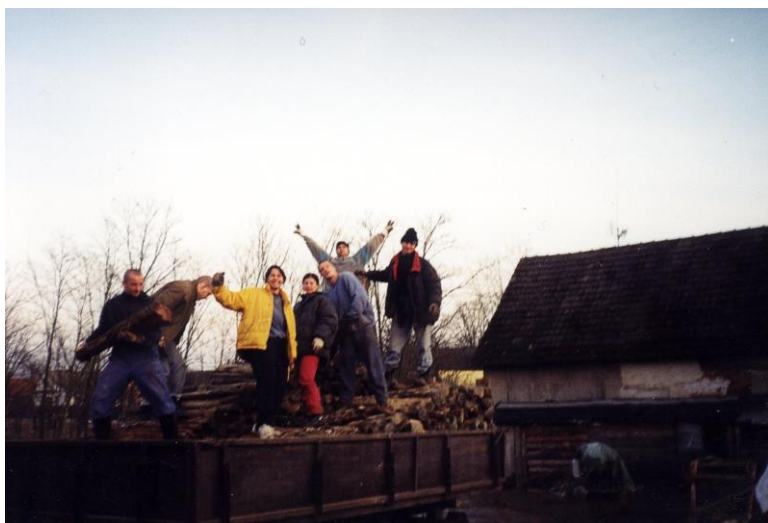
Každodenná pracovná atmosféra